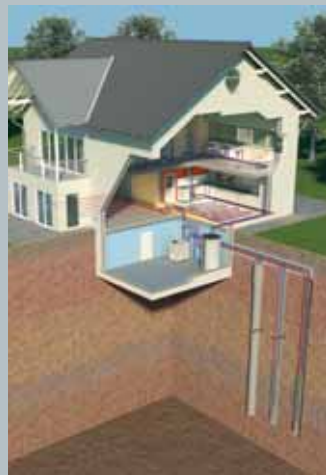
Erdwärmenutzung mit Sonden