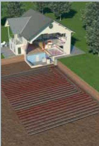
Erdwärmenutzung mit Erdregister

schutzmittel. Dieses Gemisch wird Sole genannt, daher auch der Name Sole-Wasser Wärmepumpen. Die Wärmepumpe bringt die entnommene Wärmeenergie auf die Temperatur, Vorlauftemperatur genannt, die für das Heizen des Hauses notwendig ist. Da hierfür zusätzlich Strom benötigt wird, gilt: Je tiefer die Vorlauftemperatur, desto höher die Energieeffizienz.