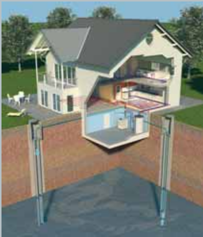
Energiegewinnung aus Grundwasser

AQUATOP T Wärmepumpen zeichnen sich durch Qualität und Zuverlässigkeit aus. Verarbeitet werden ausschließlich hochwertige Materialien. AQUATOP T Wärmepumpen erfüllen die strengen europäischen Qualitätsnormen und besitzen das internationale Wärmepumpen-Gütesiegel. Dieses umfasst nicht nur die Qualität des Produktes, sondern auch die Verlässlichkeit der Serviceorganisation.